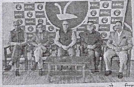
नेका उपाध्यक्ष उमर अब्दुल्ला ने की लोगों से पर्याप्त समर्थन की अपील